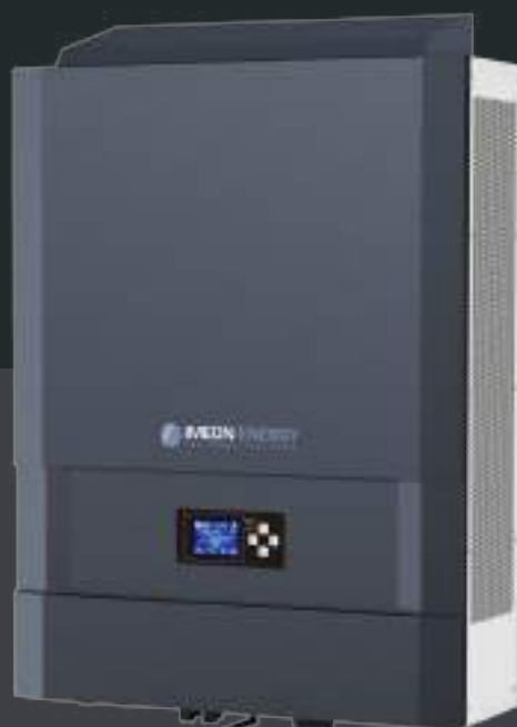
IMEON 9.12 Hasta 12kWp Trifásico