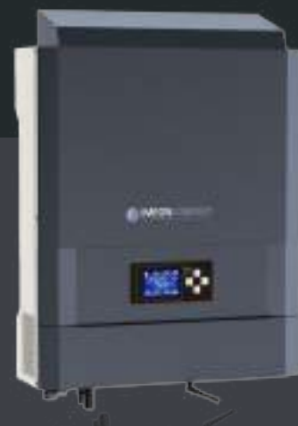
IMEON 3.6 Hasta 4kWp Monofásico